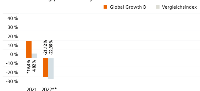
Wertentwicklung pro Kalenderjahr