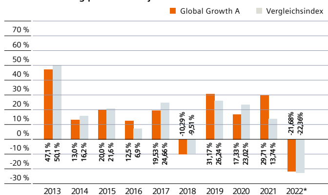
Wertentwicklung pro Kalenderjahr