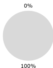
2. Alignement des investissements sur la taxinomie, hors obligations souveraines*

■ Alignés sur la taxinomie (hors gaz fossile et nucléaire) ● Non alignés sur la taxinomie ■ Alignés sur la taxinomie: gaz fossile